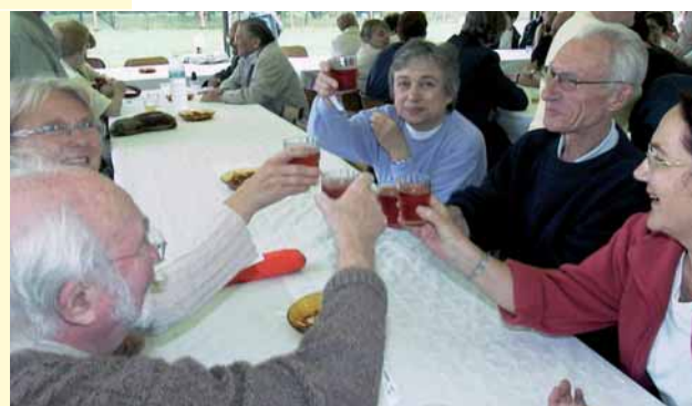
A la santé de la Marque !