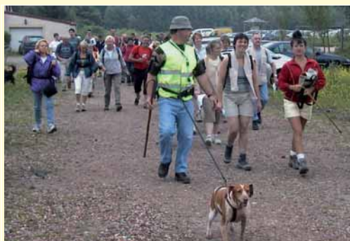
Le groupe de marcheurs confirmés

C'est bien la première fois, depuis six ans, qu'il pleut le jour de la fête de la Marque, laquelle a eu lieu, cette année le Dimanche 25 juin, et a rassemblé plus de 150 convives lors du repas champêtre. Pourtant, la matinée n'avait pas trop mal commencé pour la traditionnelle randonnée pédestre et le ciel s'est montré plutôt clément (malgré quelques petites menaces inquiétantes), épargnant ainsi les quelque cent vingt marcheurs-promeneurs qui ont pu