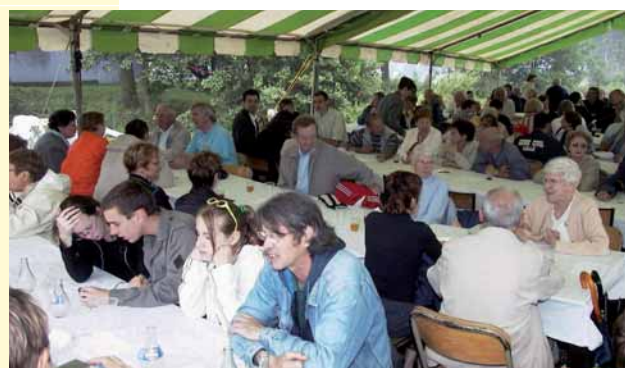
Bon appétit... malgré la pluie