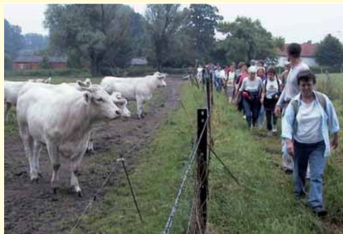
Le groupe des baladeurs

Mais ... à partir de midi, il n'a plus arrêté de pleuvoir... jusqu'au soir. Et curieusement, cette pluie persistante n'a jamais entamé le moral des troupes. Bien au contraire, il a régné, tout au long de la journée