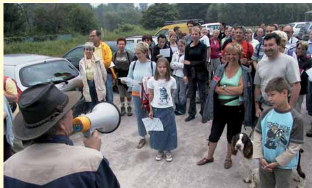
Départ pour les marais de Péronne